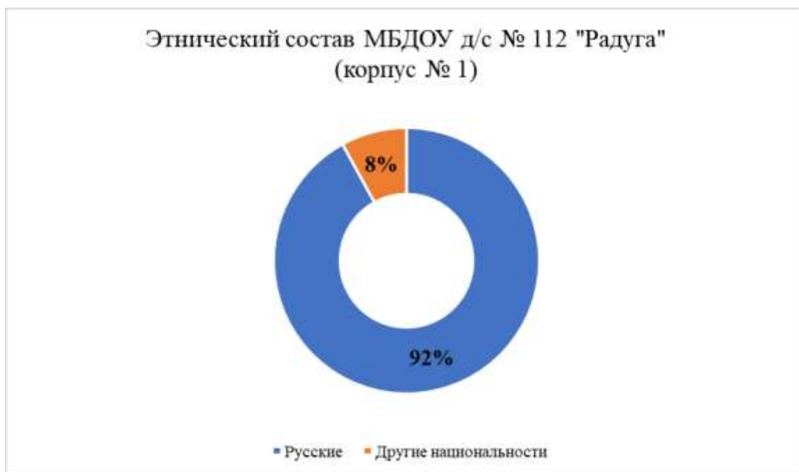
Рисунок 3. Этнический состав МБДОУ д/с № 112 «Радуга» на 2023-2024 учебный год (корпус № 1)