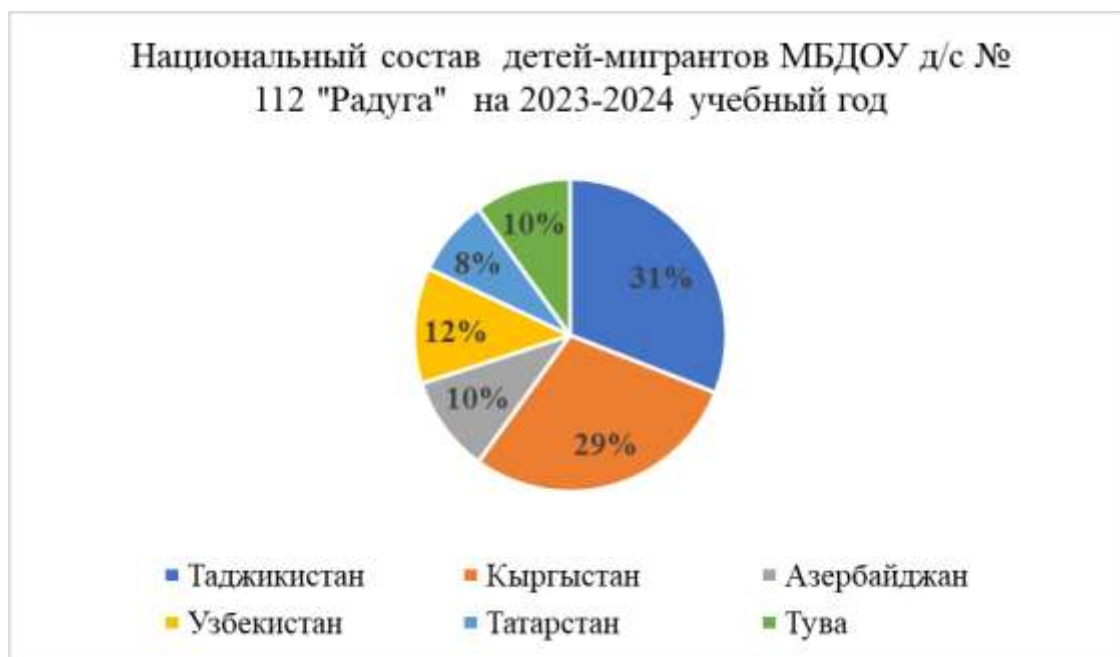
Рисунок 1. Национальный состав МБДОУ д/с № 112 «Радуга» среди детей-мигрантов на 2023-2024 учебный год

Национальный состав детей-мигрантов ДОУ можно представить следующим образом (рис.1):