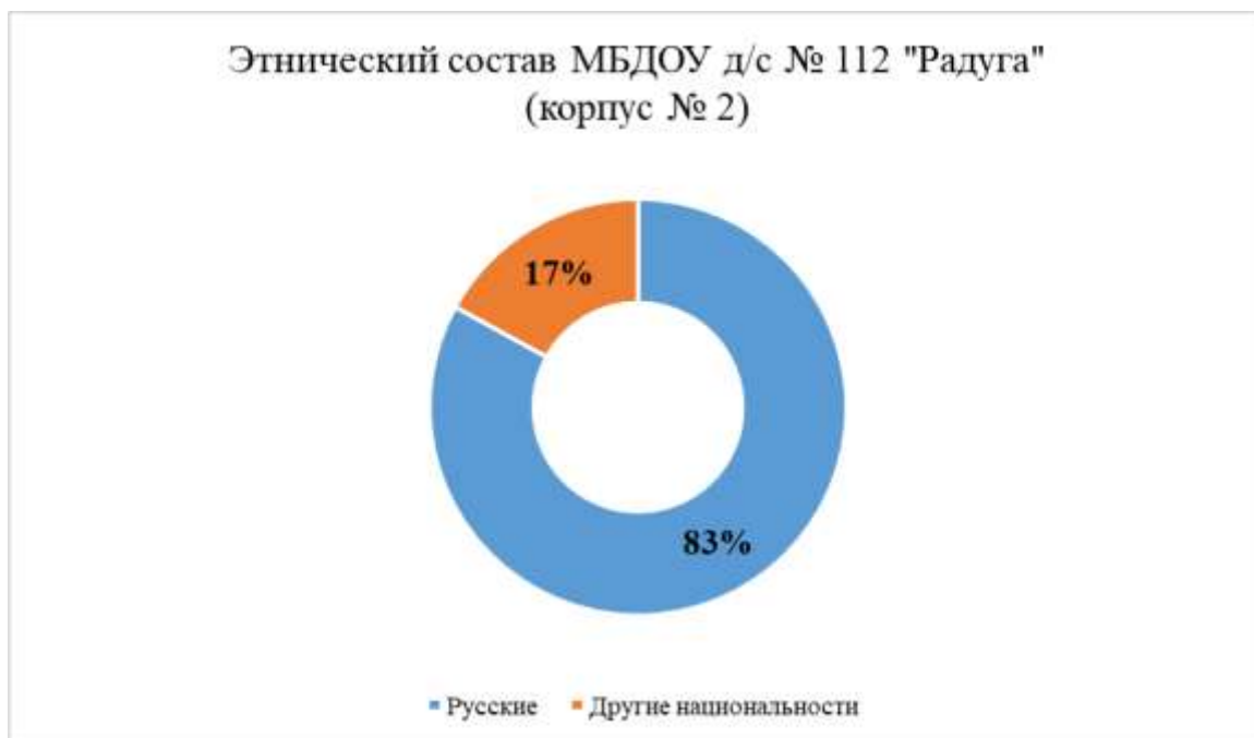
Рисунок 2. Этнический состав МБДОУ д/с № 112 «Радуга» на 2023-2024 учебный год (корпус № 2)

Нельзя не отметить ряд проблем, возникающих как у детей-мигрантов, так и у педагогов, работающих с данными детьми: